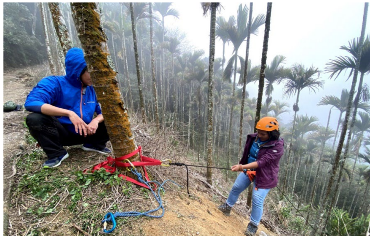
圖 3：原住民族山域嚮導訓練課程-基礎繩索技術與應用

參與本會補助之高山協作員職業訓練班的學員心有所感地指出，從老一輩的口傳歷史中，祖先與山的互動有很深的協調生存法則，對山給予的豐富產物更是抱持尊重敬畏的態度，很多有關山的生活智慧及傳統文化也在部落傳承著。如果可以整合部落高山協作資源，發展富有部落文化特色永續利用的高山協作服務，規劃部落傳統領域裡內著名的嘉明湖步道、戒茂