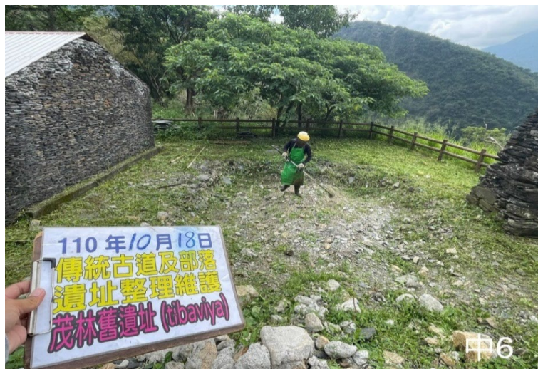
圖 4：傳統有形文化調查及維護-傳統古道及部落遺址整理維護

另計畫工作亦進行部落及傳統山川資源維護、造林區補植撫育、外來入侵動、植物預防性清除及防治等工作，並且協助支援完成天然災害救災應變工作、協助部落事項及有益於部落傳統文化事項等，自 100 年起完成造林撫育面積達 2,362 公頃，山川資源調查範圍合計達 3,168 公頃，友善部落增值服務 1,259 件，增進傳統生態資源永續利用（如圖 4、5）。