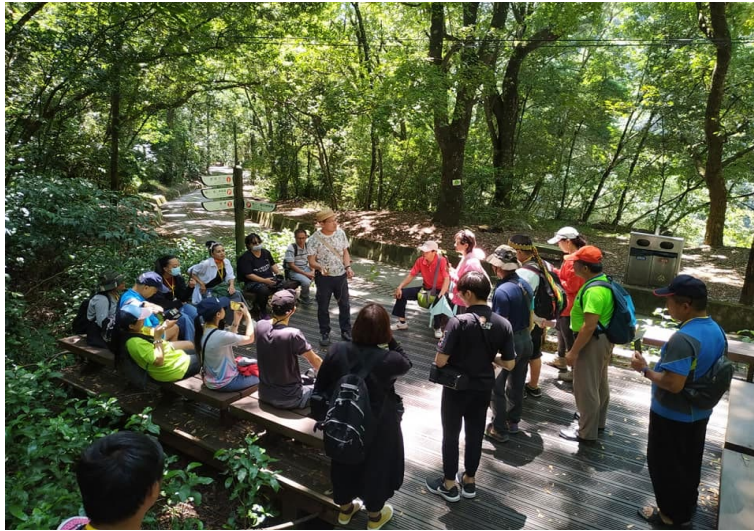
圖 1：原住民族旅遊導覽專業人才培訓

本會於 109 年及 110 年分別辦理原住民族部落旅遊導覽人才培力計畫，以在地人才優化為目標，提升經營部落旅遊之現職從業人員專業素質，希望藉由以原住民族文化為視角出發，詮釋生態旅遊、文化等，逐步建立推動原住民族文化導覽的指南，同步培育種子師資將理論與實務融合，在產業界持續擴散，以全面提升部落旅遊競爭力。109 年及 110 年共計辦理 4 梯次，共 391 名學員完成結業（如圖 1）。