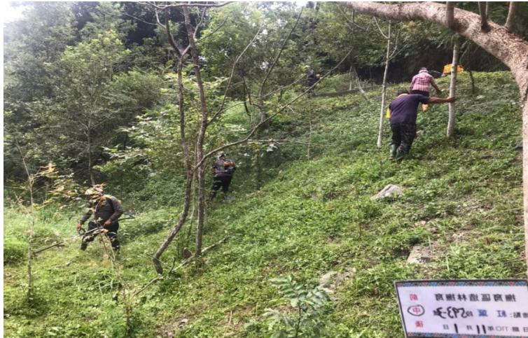
圖 5：傳統生態資源維護及永續利用-撫育區造林撫育

本會推動歷年相關自然資源保育、生態資源維護計畫，除已創造在地原住民族就業機會外，更進一步依據在地原住民族人之特性及專長，增強進行舊部落及古步道遺址維護、自然生態資源等專業技能，提升守護家鄉山林、自然資源管理能力，培力族人自身勝任原住民族傳統文化遺址（舊部落建築群、史前文化古蹟）導覽、原住民族山林自然生態導覽服務、高山嚮導指工服務，藉由不同特性之任務，使在地原住民族可以在部落，以自己的能力，並拓展部落傳統文化遺址、自然生態保育知識以及原住民族語言推廣，提升自我文化認同使命。